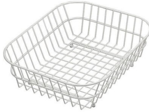
Cesta blanca de acero inoxidable 8612 000