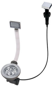
Desagüe automático 8407 113