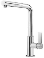
Monomando Omega Plus 8497 020