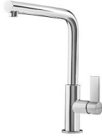
Monomando Omega 8497 000