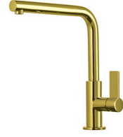
Monomando Omega Gold 8497 700